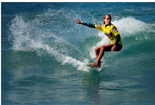
Vui Đùa Trên Mặt Nước

Kính Mời Đồng Bào Đến Dự – Vào Cửa Miễn Phí